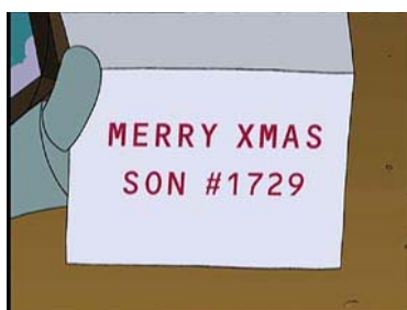
Figura 8: Bender 1729