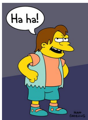
Figura 4: Nelson y la raíz cuadrada de 2

La raíz cuadrada de un millón es mil, lo que no tiene nada de misterioso. La observación de Nelson es mucho más interesante en la versión en español, donde se refiere a la raíz cuadrada de dos. Siendo un número irracional, la raíz cuadrada de dos tiene infinitos dígitos y, efectivamente, nadie nunca podrá conocerlos a todos.