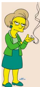
Figura 6: La maestra Krabappel

La maestra Krabbappel es nominada al premio de Maestra del año. Al final pierde el premio a manos de “Julio Estudiante, por haber enseñado a los estudiantes que las ecuaciones diferenciales son más poderosas que las balas”.